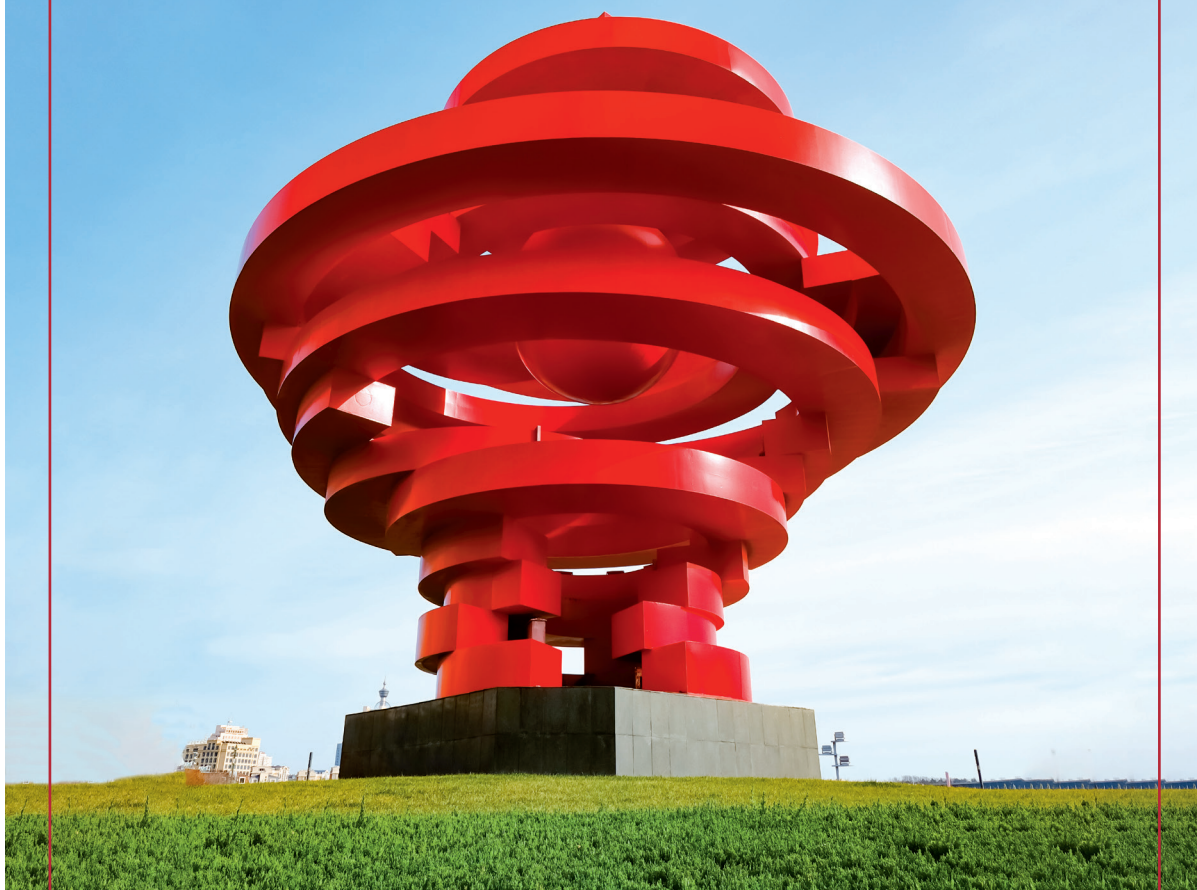
Place du 4 Mai, Qingdao, province du Shandong

Tout le monde ne connaît pas l'histoire du Parti communiste chinois. A cet effet, vous êtes invités à expliquer, les mérites des précurseurs Chen Duxiu, Li Dazhao ou d'autres à l'appui, comment le mouvement du 4 Mai contribue à la diffusion du marxisme en Chine et à la fondation du PCC en 1921.